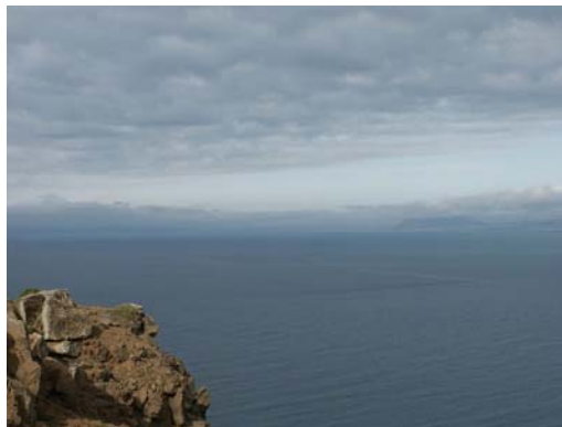
BO 19: Blick nach NE