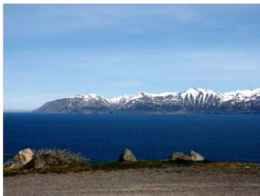
Blick über den Eyjafjörður nach NE