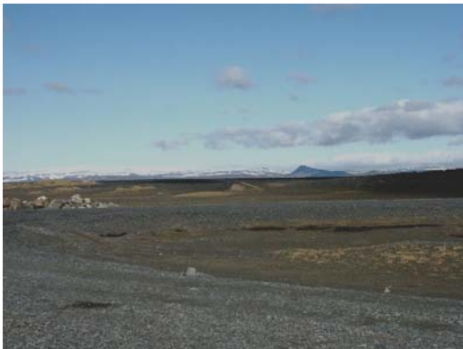
Hrossaborg: Blick nach NE