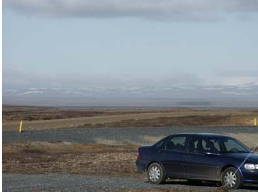
Am Funkmast: Blick nach NE