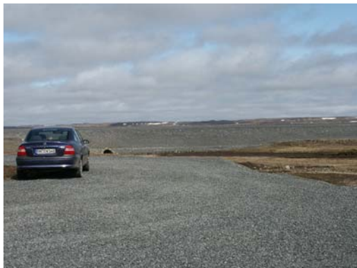
Blick über die Parkfläche nach NE

Die Gegend liegt weitab jeder Ortschaft in einer wüstenartigen Landschaft. Es handelt sich um ein intramontanes Becken, das von Wolken etwa abgeschirmt ist. Wolken können aber an den umliegenden Bergen hängen und so die Sicht auf die tiefstehende Sonne verdecken.