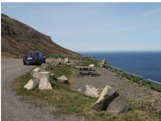
Der eigentliche Rastplatz