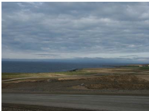
Blick über die Bucht nach NE

Da der Parkplatz direkt an der Küste nur etwa 50 m ü. NN. liegt, ist das Nebelrisiko entsprechend hoch. Diese Stelle könnte durch lokale Beobachter aus Húsavík ebenso wie durch andere Sonnefinsternis-Gruppen stärker frequentiert sein.