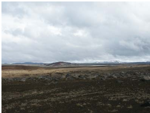
Blick von der Piste nach NE

In den vergangenen beiden Jahren war die S864 Ende Mai noch gesperrt.