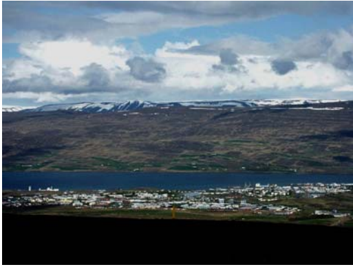
Blick vom Hlíðarfell nach NE