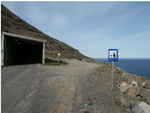
Blick über das gesamte Areal

Der Parkplatz liegt ca. 150 m ü. NN; die Gefahr von Seenebel ist daher recht hoch.