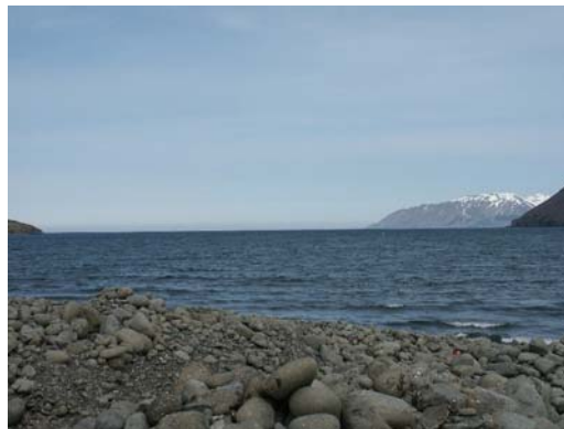
Blick über den Fjord nach NE