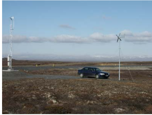
Parkfläche am Funkmast