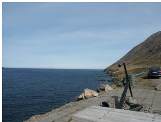
Blick vom Parkplatz nach NE