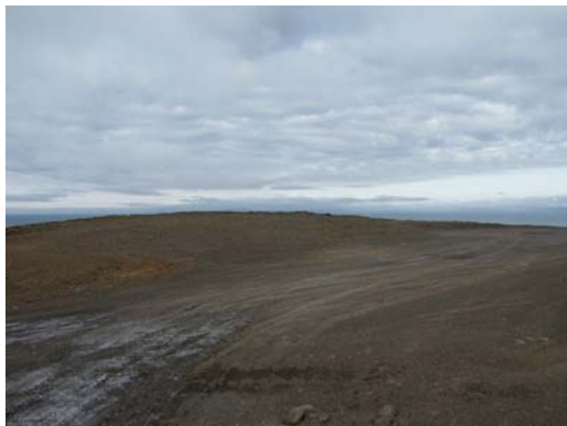
BO 18: Die Kiesfläche

Es ist denkbar, dass die alte Trasse nach Fertigstellung der neuen S85 ganz gesperrt wird. Dann wäre diese Stelle nur noch zu Fuß erreichbar. Eine aktuelle Standorterkundung vor der SoFi ist daher dringend anzuraten.