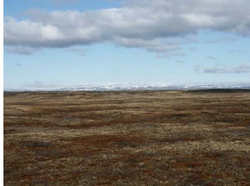
Bei Peturskirkja: Blick nach NE