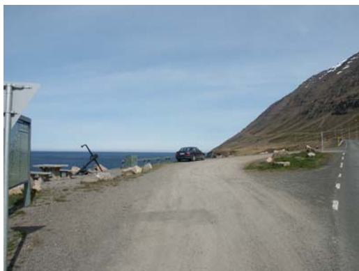
Parkplatz am Fjordhang