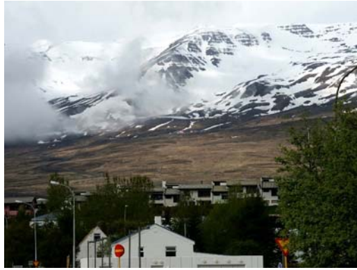
Blick von Akureyri zum Hlíðarfell