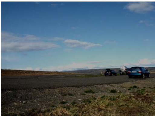
Blick über den Parkplatz nach NE

Wir haben mehrfach erlebt, dass Nebel von der über 40 Kilometer entfernten Küste bis hier herauf ziehen kann.