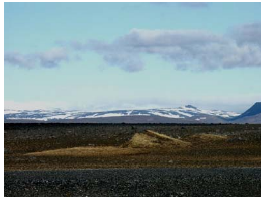
Hrossaborg: Blick nach NE mit Tele