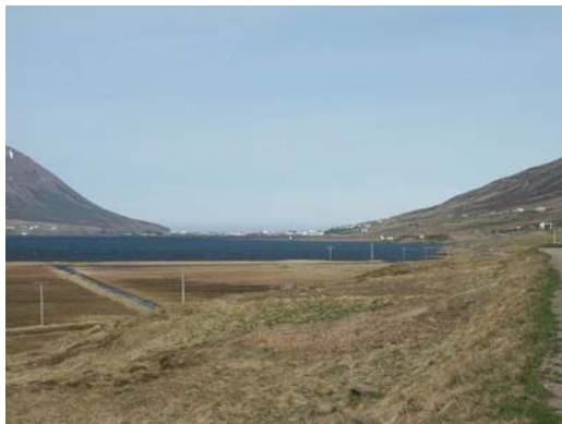
Blick auf den Ort Ólafsfjörður

Eine von dem bekannten NASA-Finsternisexperten Fred Espenak geleitete amerikanische Reisegruppe plant, die Sonnenfinsternis in Ólafsfjörður zu beobachten.